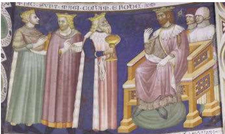
Hic sunt Magi coram Erode.

Per rappresentare le tre razze principali, si dice che un mago è bianco, uno nero, uno giallo.